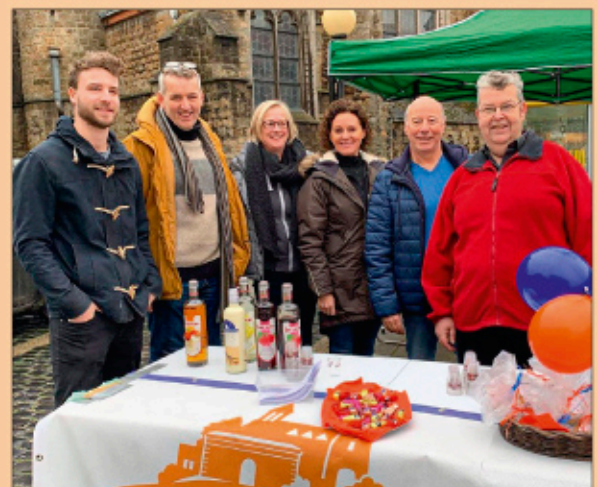
Steeds paraat voor het goede doel