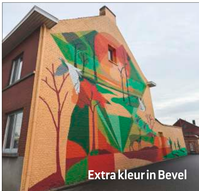
Extra kleur in Bevel

Na de muurschildering aan GC 't Dorp in Kessel was het onlangs de beurt aan Bevel om een kleurrijk tafereel te ontvangen.