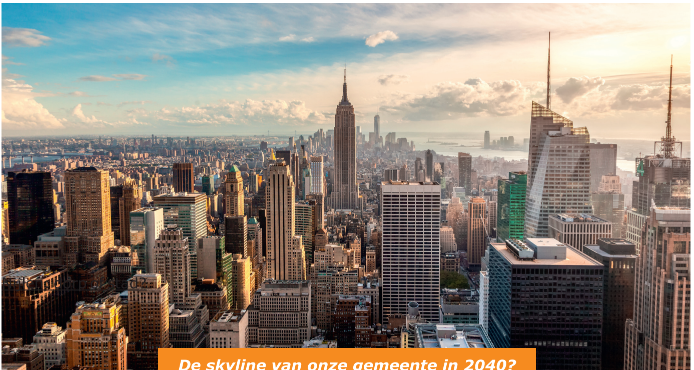
De skyline van onze gemeente in 2040?

Het is nog aangenaam vertoeven in het landelijke groen en de open ruimtes van onze gemeente. Maar binnen onze dorpskernen gaat het de verkeerde kant op. We zien steeds meer grote bouwprojecten opduiken waardoor het uitzicht van onze dorpskernen in snel tempo verandert. Sommige zijn geslaagd, andere niet. De bouwwoede gaat ten koste van het groen en zorgt voor een verstedelijking van onze gemeente. Om nog maar te zwijgen over de extra verkeersdrukte . Bouwvergunningen voor grote projecten worden vlotjes uitgereikt. Groene plekjes moeten plaats ruimen voor steen, beton en kunstmatig aangelegde parkjes en wadi's. Nieuw Nijlen ijvert voor een groene en dorpse gemeente. Wij eisen dat er voldoende voorwaarden worden opgelegd voor het behoud van groen in nieuwe projecten, de bepanking van hoogbouw en een correcte financiële bijdrage van de bouwheer voor de kosten die grote projecten meebrengen.